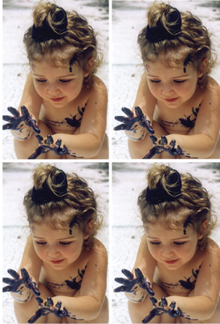
Đây là giai đoạn thấp nhất của luân xa muladhara .